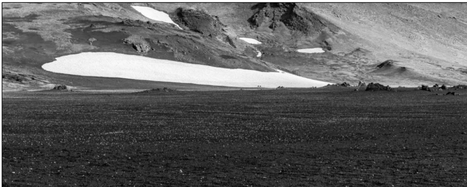
Rys. 3. Krajobraz nr 1