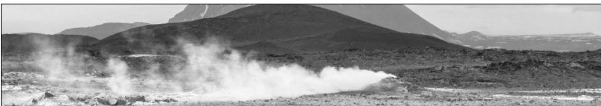
Rys. 4. Krajobraz nr 2