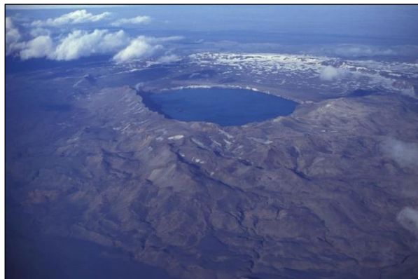
Rys. 2. Wulkan Askja